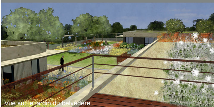
Vue sur le jardin du belvédère