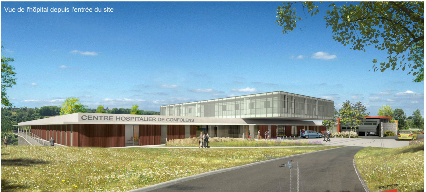
Vue de l'hôpital depuis l'entrée du site