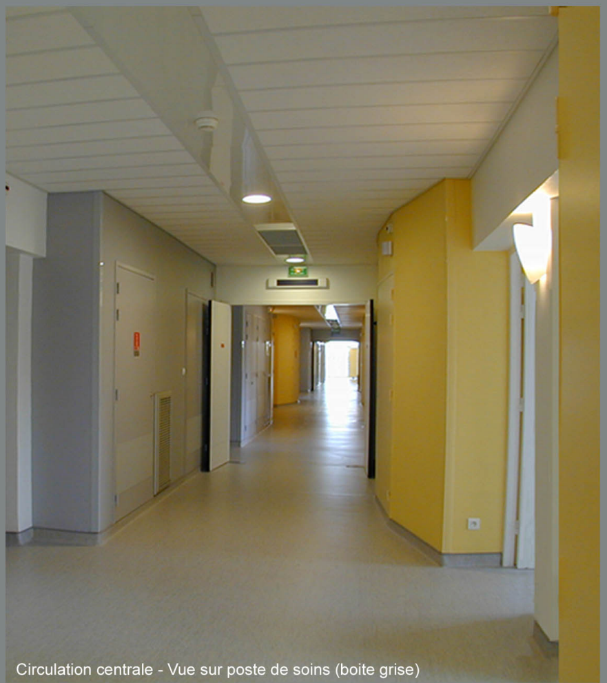
Circulation centrale - Vue sur poste de soins (boite grise)