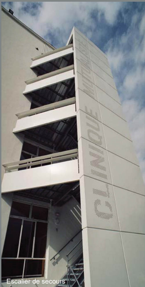
Escalier de secours