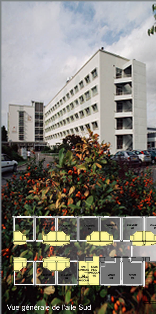
Vue générale de l'aile Sud